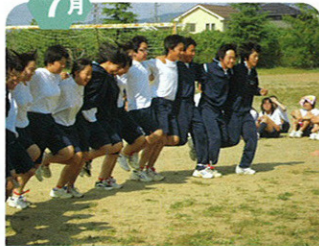
夏期クラスマッチ